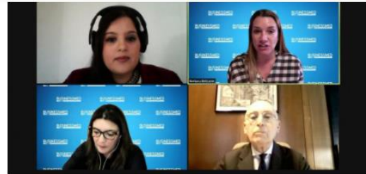
Vue du webinaire.

Les interventions des autres panélistes se sont concentrées sur la présentation des différentes étapes qui ont conduit à la conception et à l'élaboration de la plateforme, l'objectif de sa mise en œuvre et ses principales fonctions afin d'exposer les différents avantages qu'elle offre pour l'écosystème d'affaire méditerranéen.