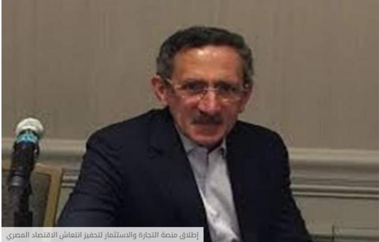
إطلاق منصة التجارة والاستثمار لتحفيز انتعاش الاقتصاد المصري

اقتصاد بوابة فيتو منذ 3 أيام 0 تليغ x حذف